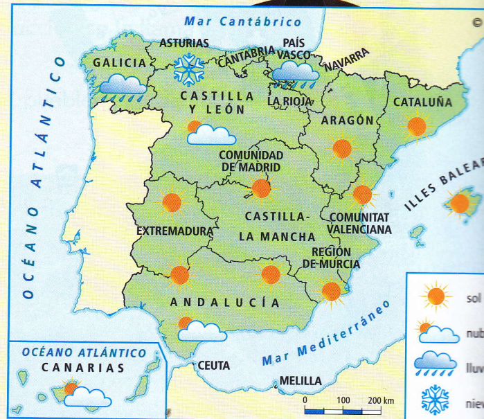
Mapa del tiempo. Informa sobre el tiempo atmosférico de un lugar (comarca, país, continente...).