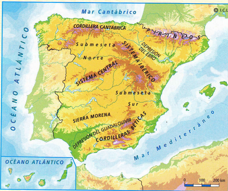
Mapa físico. Proporciona información sobre el relieve, los mares y los ríos.