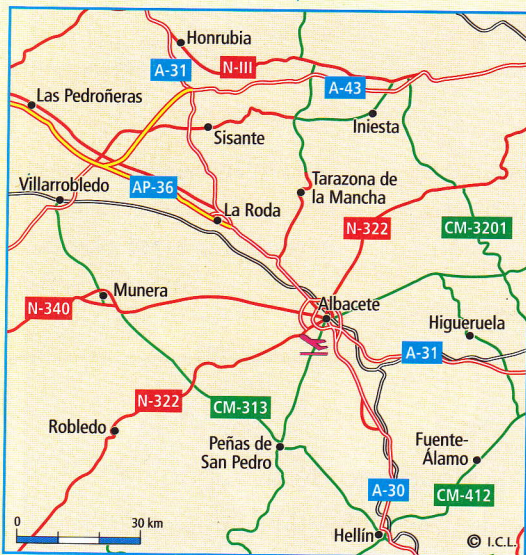
Mapa de comunicaciones. Están dibujadas las vías de comunicación: carreteras, autopistas, ferrocarril, puertos y aeropuertos.